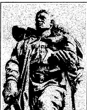
Нашим соотечественникам уже не раз доводилось спасать немецких детей